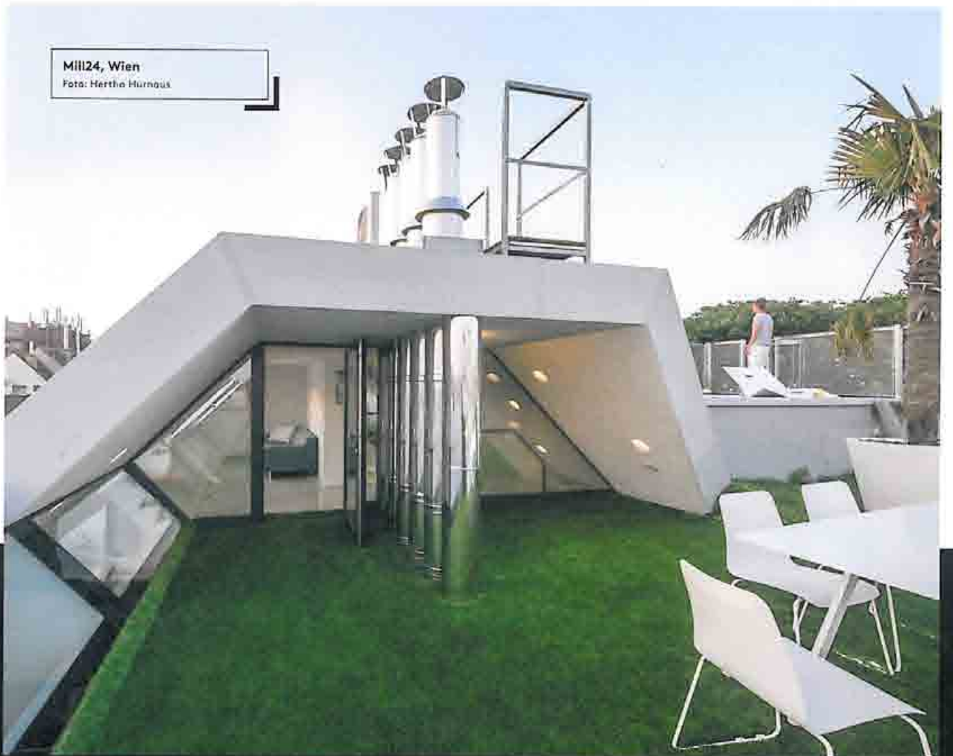
Mill24, Wien