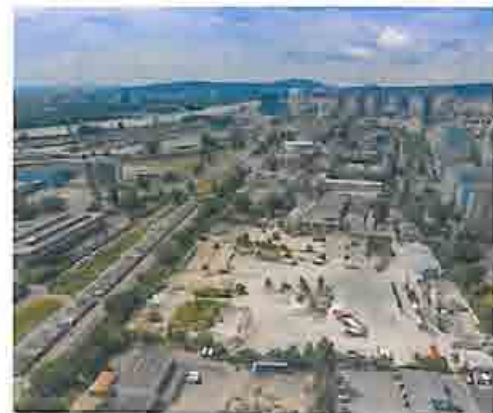
Atrium 1/2020 atriummagazin.sk — Koktail

Významný staviteľ YIT, ktorý si v slovenskej metropole vybudoval skvelé renomé viacerými objektívne vydatými projektmi obytných súborov, sa chystá «zahryznúť» do ďalšej spustnutej časti mestského «brownfieldu» (opusteného priemyselného areálu). Tentoraz si vyhládol pozemok bývalej panelárne a príslahlých dvorov v časti Mlynské nivy-západ. V prvom kroku YIT ohlasuje prípravu architektonickej súťaže na novú mestskú štvrť so zmiešanými funkciami – tak, aby zónu premenil na živé, zdravé a obľúbené miesto pomocou priaznivých revitalizačných účinkov novej výstavby. Osobitnú pochvalu si zaslúži zámer priniesť do lokality západných Nív (dosiaľ zafaženej prevládajúcou administratívnou výstavbou) aj obytnú funkciu, čím dôjde ku korekcii vyváženého mestského tkaniva. yit.sk